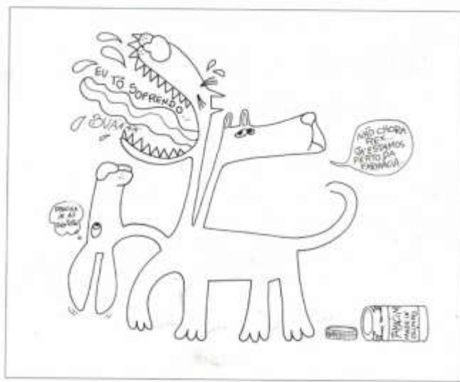
Figura 1 – Exemplo de situação-problema com mais de uma solução.

B) Isso é um cêrbero. Cada vez que uma das suas cabeças está doendo, ele tem que tomar quatro comprimidos. Hoje as suas três cabeças tiveram dor. Mas o frasco já estava no fim e ficou faltando comprimidos para uma cabeça. Quantos comprimidos haviam no frasco?!