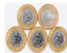
Figura 2 – Tarefa elaborada pelos futuros professores, 2018.