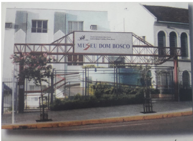
Figura 1: Fachada do Museu Dom Bosco

Em 2005, o museu foi transferido para o Parque das Nações Indígenas, o nome do parque faz uma homenagem às etnias indígenas do Estado do Mato Grosso do Sul. (CASTILHO, FERREIRA, 2012).