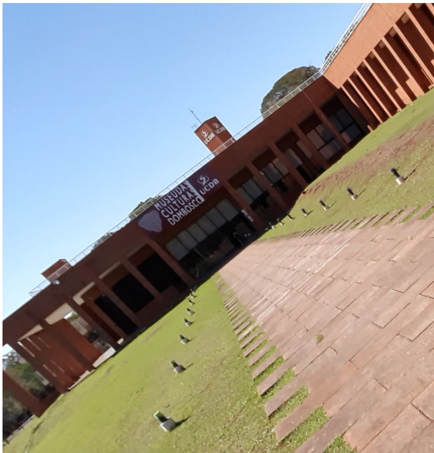
Figura 2: Fachada atual do MCDB

Diante dessa afirmação, constatamos a importância do MCDB como local para o desenvolvimento de ações educativas, não-formais, como apoio a educação científica escolar, uma vez que propicia, por meio de seu acervo, o contato com conhecimentos científico-culturais.