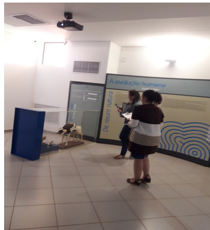
Figura 6: Professores analisando a exposição de Vertebrados no MCDB.

No quarto encontro, realizado na UFMS, os professores explanaram as suas considerações sobre a exposição do acervo de Zoologia de Vertebrados. Todas as impressões