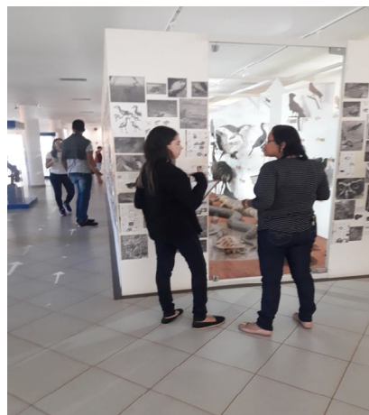
Figura 4: Professores analisando a exposição de Vertebrados no MCDB.