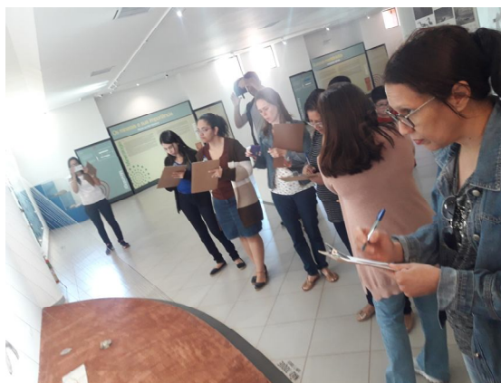
Figura 5: Professores analisando a exposição de Paleontologia no MCDB.