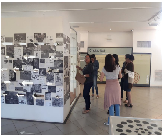
Figura 3: Professores analisando a exposição de Vertebrados no MCDB.

Os participantes foram (re) conhecer a exposição de Vertebrados e fizeram as anotações pertinentes à exposição. Nesta etapa, os professores ficaram cerca de 1 hora e 30 minutos observando e analisando a referida exposição. Nesse momento, os grupos se reuniram para discutir as estratégias para explorar o acervo em atividade da SD.