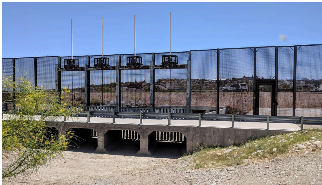
Figura 1 – Cerca divisória entre Juarez, Chihuahua, México e El Paso, Texas, EUA