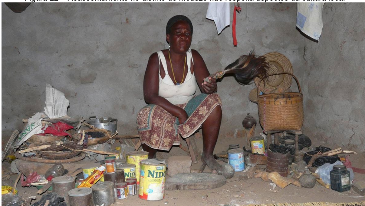
Figura 22 – Reassentamento no distrito de Moatize não respeita aspectos da cultura local