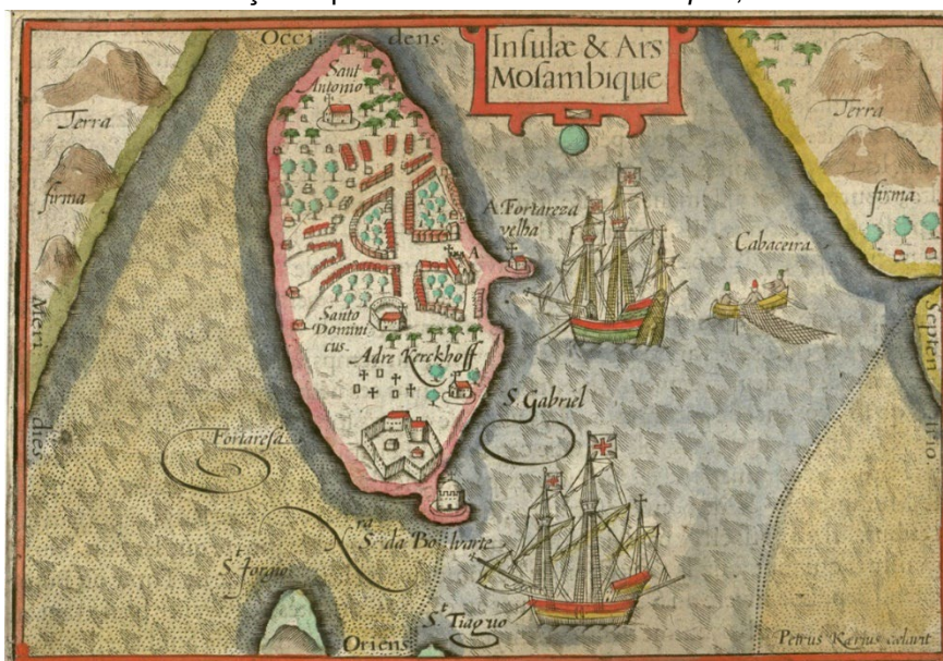
Figura 2 – Ilha e Fortaleza de Moçambique: “ Insulae & Ars Mosambique ”, de Pieter van den Keere, 1598

73