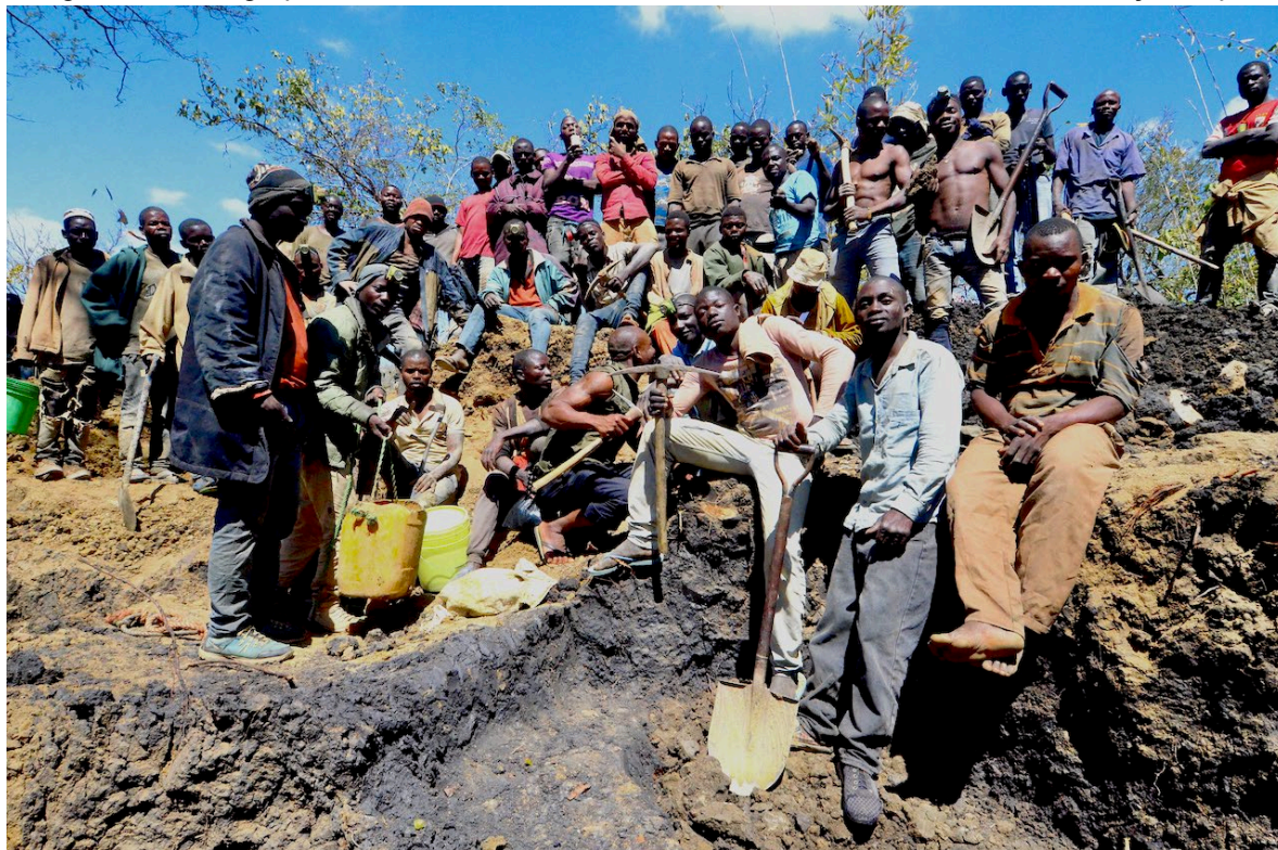
Figura 19 – Um grupo de mineiros artesanais em Nthoro, Namanhumbir, Norte de Moçambique