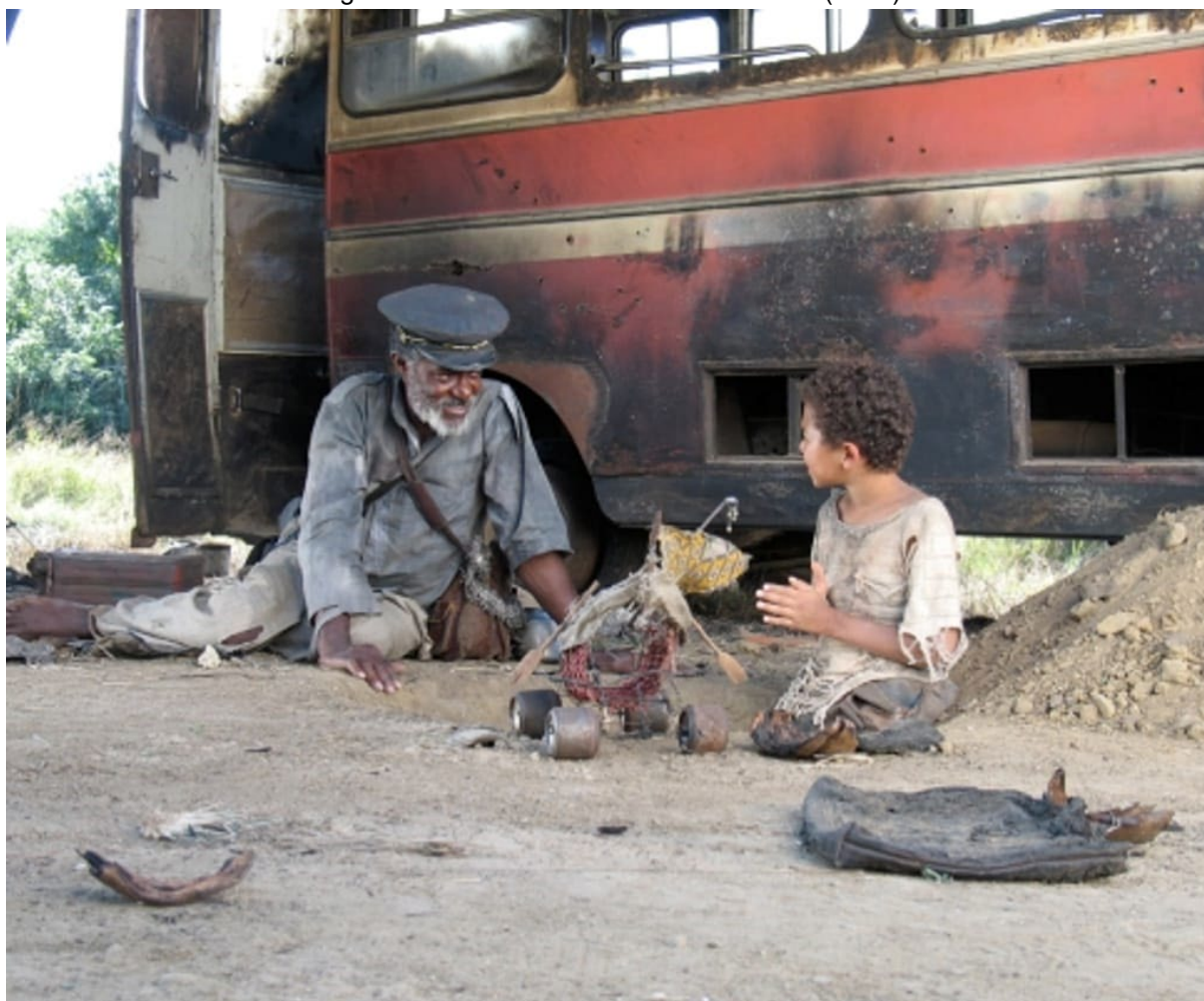
Figura 5 – Cena do filme Terra sonâmbula (2007)