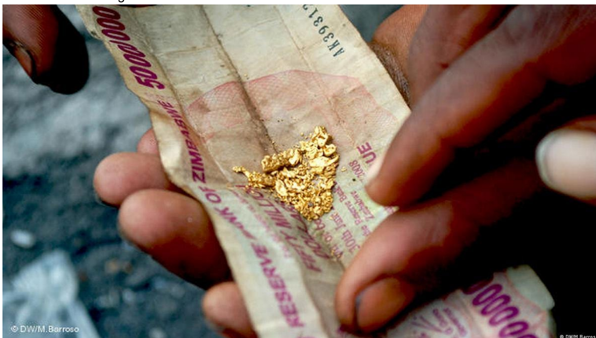
Figura 26 – O ouro em nota de 50.000.000 de dólares zimbabuano