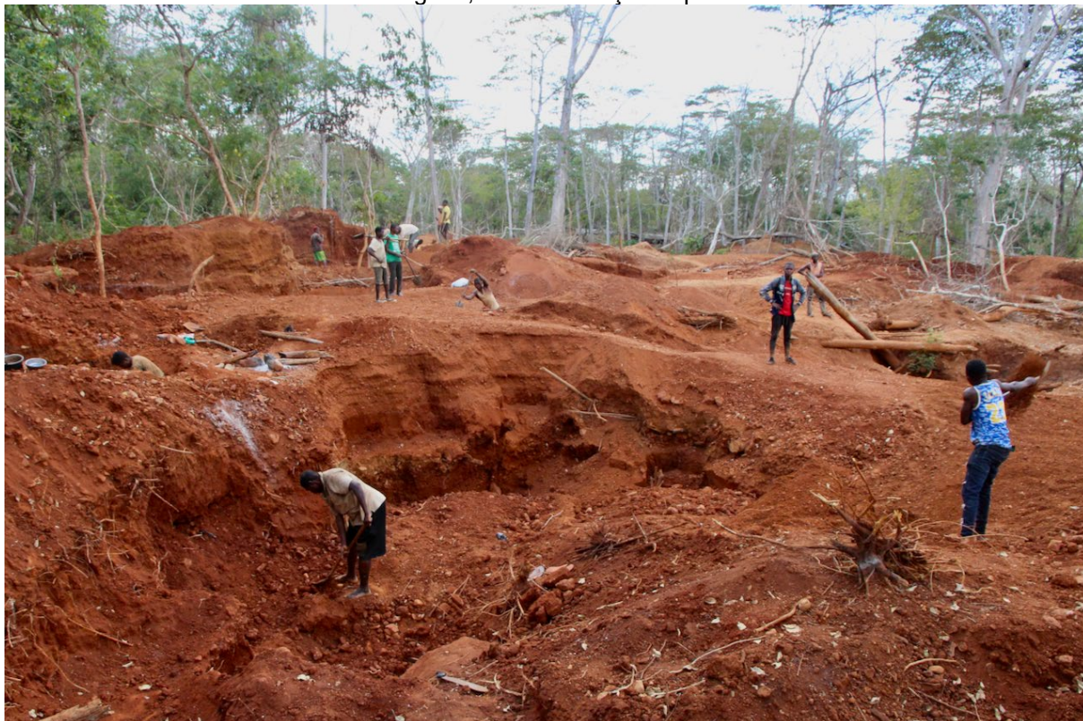
Figura 24 – Área mineira de Nakaka, dentro da concessão da Montepuez Ruby Mining , Cabo Delgado, Norte de Moçambique