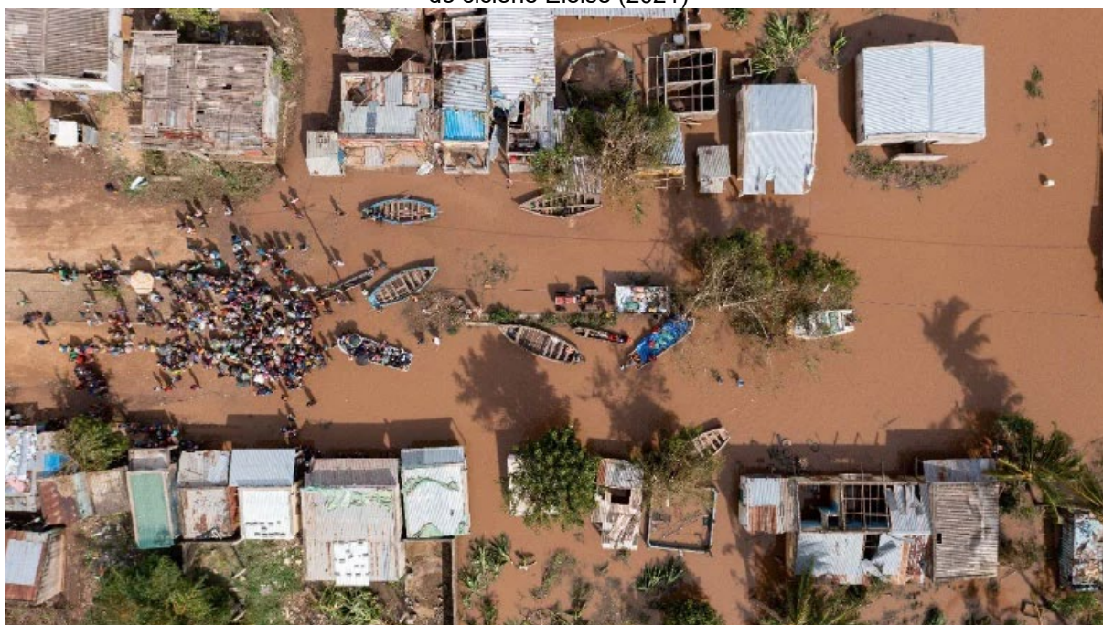
Figura 11 – Evacuação da população local no distrito de Búzi, província de Sofala, em consequência do ciclone Eloise (2021)

Vale ressaltar que um sistema de alerta é importante, mas não suficiente, diante da falta de vontade institucional permeada por interesses políticos que muitas vezes não priorizam a mitigação de impactos ambientais, culminando em eventos climáticos extremos. Com a passagem do ciclone Eloise na província de Sofala, a população foi evacuada (Figura 11).