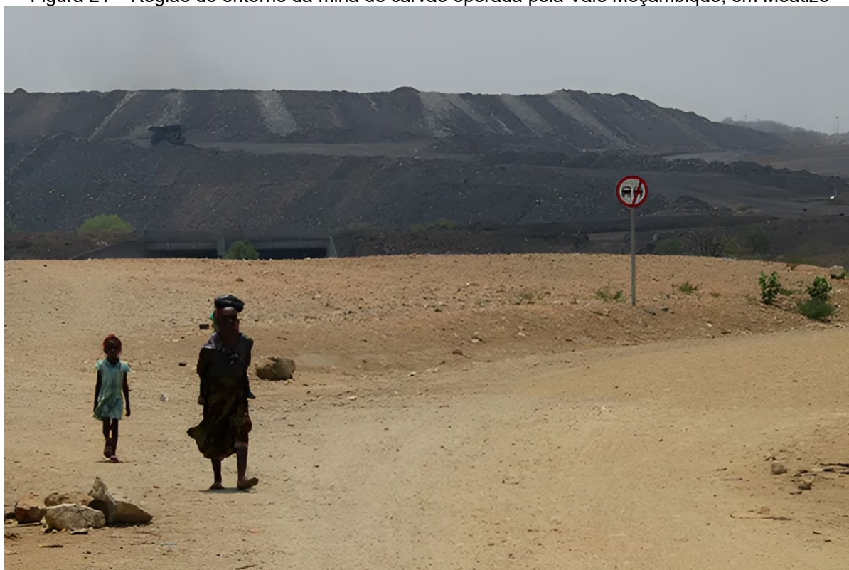
Figura 21 – Região de entorno da mina de carvão operada pela Vale Moçambique, em Moatize

João Mosca esclarece que, acerca das instalações da mina de carvão em Moatize, “a Vale, como outras mineradoras, no lugar de ser um agente de desenvolvimento económico e social, é, na verdade, provocadora de efeitos e externalidades negativas de dimensão que superam os possíveis benefícios da actividade e da actuação das empresas” (Mosca, 2022, p. 1). A Figura 21 destaca uma mulher e uma criança caminhando no entorno da mina de carvão em Moatize.