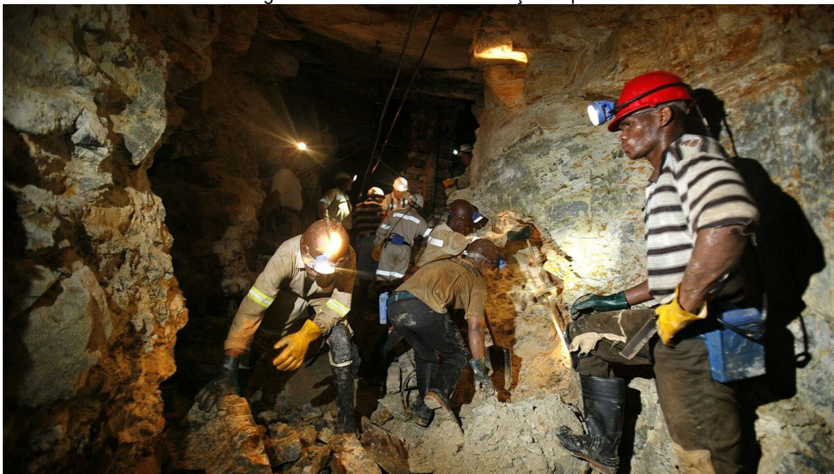
Figura 27 – Mina de ouro em Moçambique

Fonte: Diário Económico (2023, online). 140