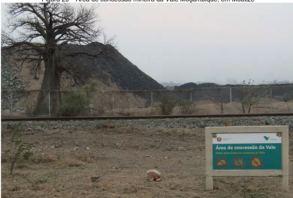
Figura 20 – Área de concessão mineira da Vale Moçambique, em Moatize

Com propostas de desenvolvimento, a mineradora Vale Moçambique obteve concessão e instalou uma mina de carvão em Moatize. Em uma publicação na plataforma Friends of the Earth International , intitulada “A deadly ring of coal: Vale’s poisoned gift to Mozambique” (Um anel mortal de carvão: o presente envenenado da Vale para Moçambique), revelou que “a Vale abandonou quase meio milhão de pessoas que terão que viver dentro de um cerco letal de carvão durante pelo menos 35 anos” (FoEI, 2022, online). A Figura 20 destaca a área de concessão da Vale na província de Moatize.