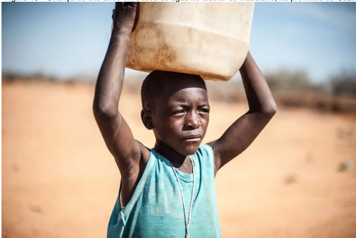
Figura 15 – Criança de oito anos em busca de água no distrito de Mabalane, na província de Gaza

Ainda como forma de racismo ambiental, em consequência de eventos climáticos extremos, uma criança caminha quilômetros em busca de água de um poço artesiano, no distrito de Mabalane (Figura 15).