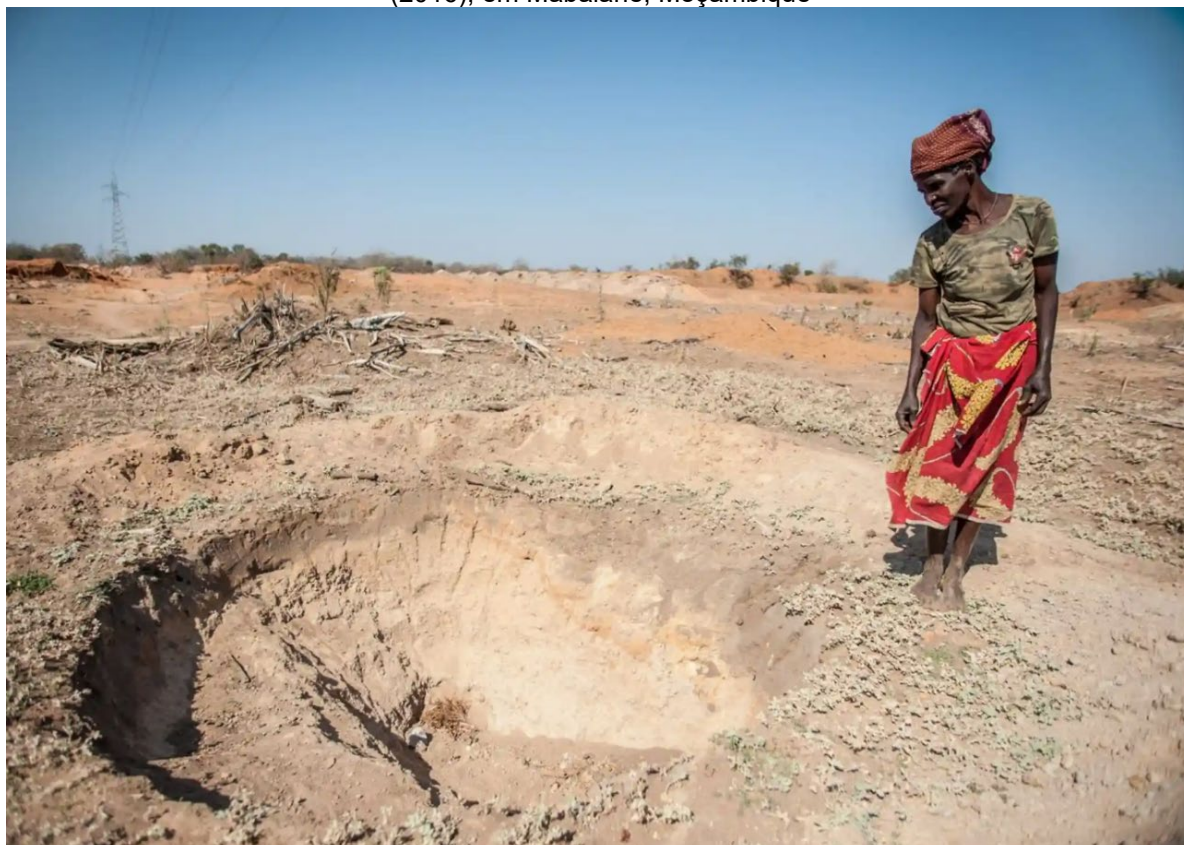
Figura 14 – Adelaide Maphangane ao lado de um poço sem água, em consequência do El Niño (2016), em Mabalane, Moçambique

Com as consequências do El Niño, em Moçambique, no ano de 2016, comunidades tradicionais sofreram com a seca extrema, uma realidade que persiste a cada passagem desse evento climático. A Figura 14 retrata um dos aspectos do enfrentamento da seca em Moçambique.