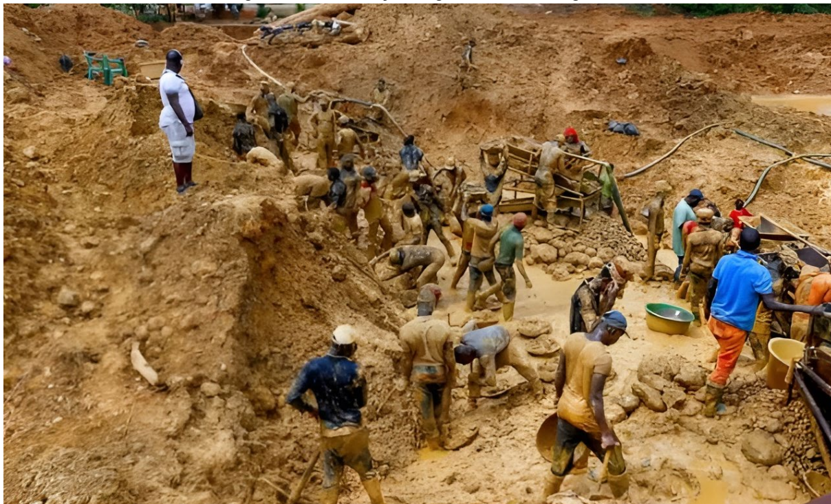
Figura 25 – Mineração ilegal em Cabo Delgado

A exploração de rubis pela Montepuez Ruby Mining na região de Namanhumbir, distrito de Montepuez, em Cabo Delgado, é processada de forma regulamentada. Por outro lado, a mineração acontece a céu aberto (Figura 25).