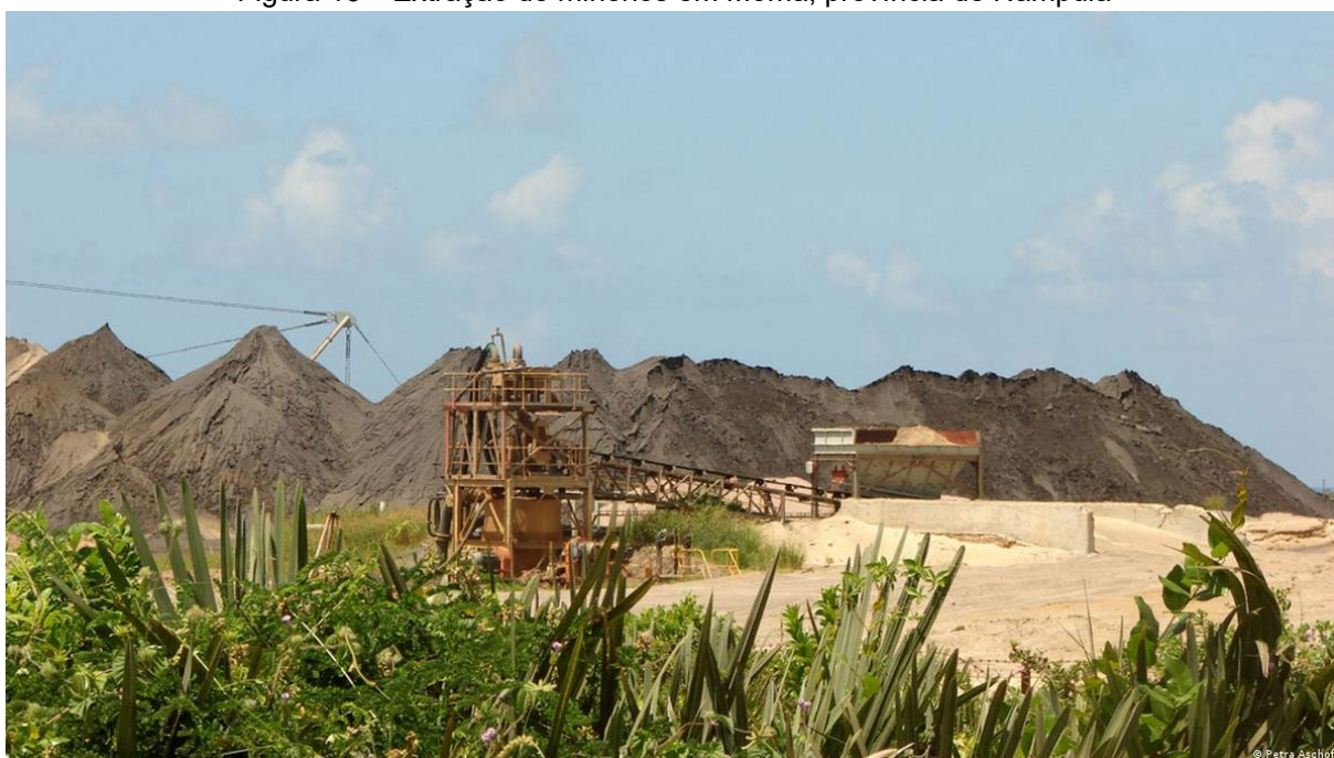
Figura 16 – Extração de minérios em Moma, província de Nampula