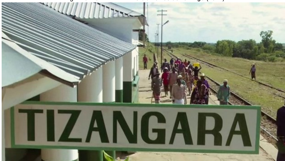
Figura 6 – Cena do filme O último voo do flamingo (2011)

No romance e na percepção das imagens no filme, são retratadas as consequências da guerra e o impacto refletido na comunidade local afetada por fatores externos. Em uma referência à cultura do lugar, uma das personagens relata que “os flamingos eram eles que empurravam o sol para que o dia chegasse ao outro lado do mundo” (Couto, 2005, p. 30). Nesse cenário, ficção e cultura se mesclam, evidenciando um sentimento de pertencimento que pode ser conferido na forma como as personagens revelam as nuances do lugar (Figura 6).