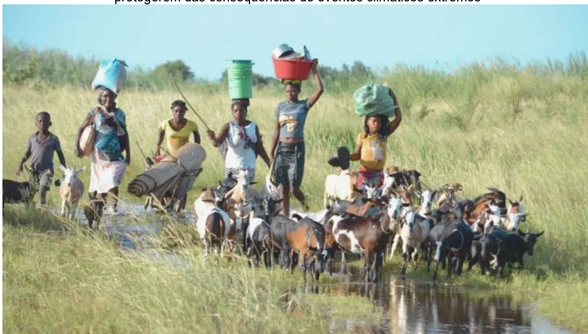
Figura 12 – Família deslocada com animais e pertences em busca de um lugar seguro para se protegerem das consequências de eventos climáticos extremos