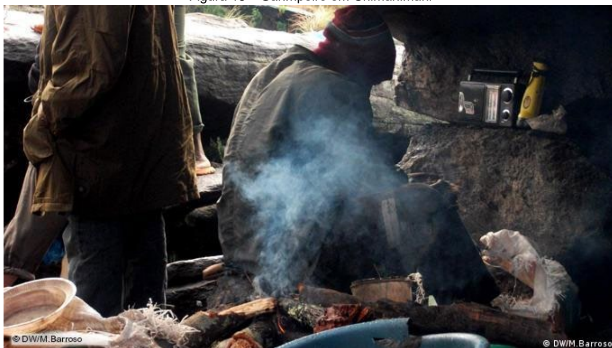
Figura 18 – Garimpeiro em Chimanimani