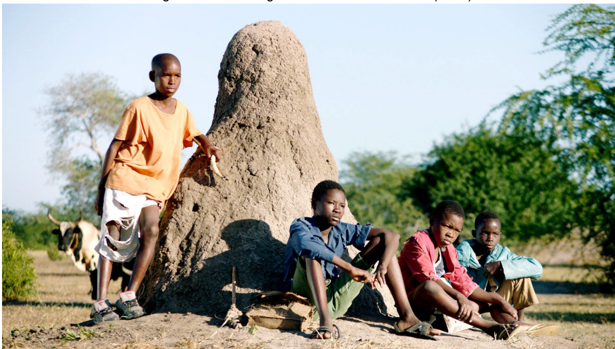
Figura 7 – Personagens do filme Mabata Bata (2017)

Fonte: TV Brasil: EBC (2017, online) 132