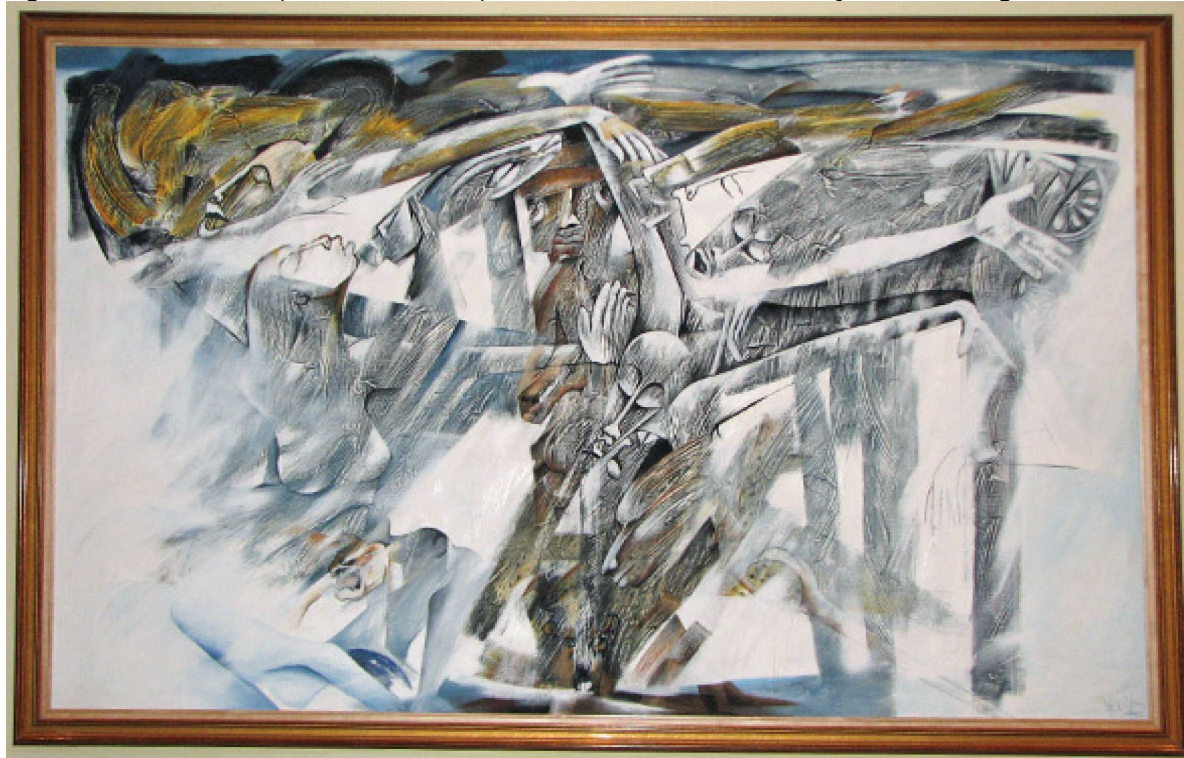
Figura 23 – “Gandzelo” ( The Sacred Tree ). Óleo sobre tela do artista moçambicano Naguib Elias Abdula

Em uma leitura de imagem, destacamos a arte intitulada “Gandzelo” ( The Sacred Tree ), A árvore sagrada , óleo sobre tela do artista moçambicano Naguib Elias Abdula (Figura 23).