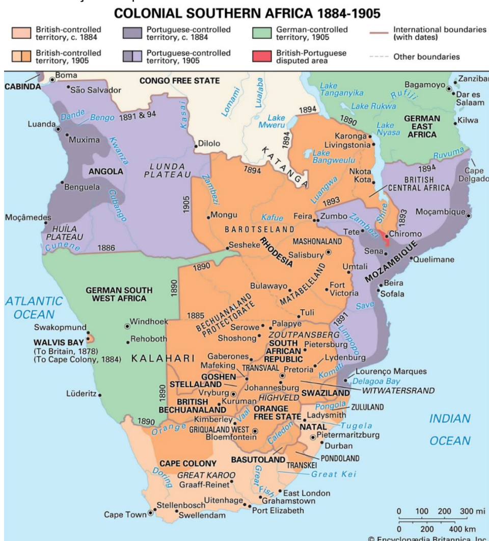
Figura 3 – Penetração europeia na África Austral no final do século XIX e início do século XX

Com foco nessa forma de exploração voltada para o controle de territórios e recursos minerais na região, alimentou a chamada “corrida” na África do Sul. O mapa de situação a seguir evidencia a penetração europeia na África Austral no final do século XIX e início do século XX (1884 a 1905), o qual inclui o território de Moçambique. Esse mapa nos fornece uma visão detalhada de como ocorreu a ocupação e dominação europeia na porção sul do continente africano, onde está localizada Moçambique (Figura 3).