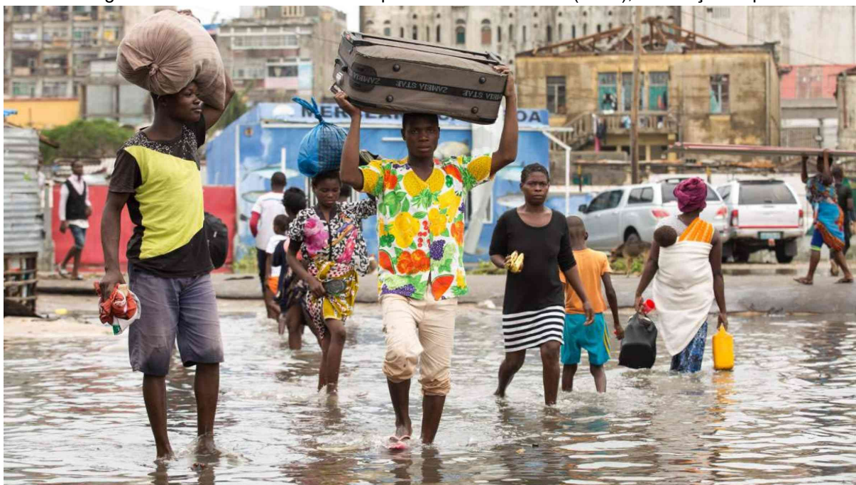
Figura 10 – Deslocados em consequência do ciclone Idai (2019), em Moçambique

136