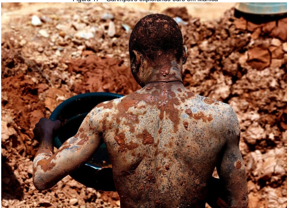
Figura 17 – Garimpeiro explorando ouro em Manica