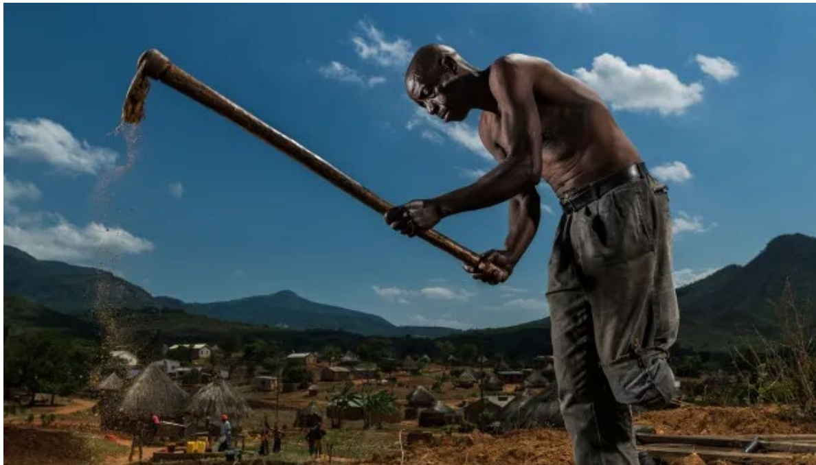
Figura 8 – Vítima de mina antipessoal em Moçambique