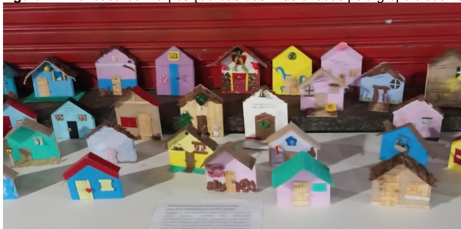
Figura 11: Bancada com exposição das casinhas criadas pelo grupo discente.

Todo final de bimestre a Escola promove um encontro denominado Família na Escola, no período noturno, durante o qual os pais são recebidos com uma palestra, música, exposição de trabalhos e entrega das notas. No encontro que aconteceu próximo ao desenvolvimento da Intervenção Pedagógica relatada nesta pesquisa, durante o mês de novembro, foi comemorado o Dia da Consciência Negra.