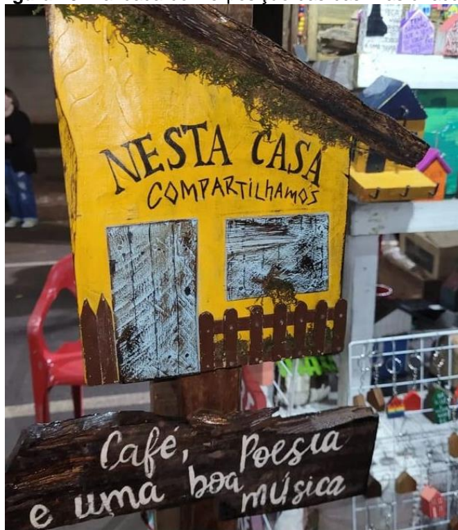
Figura 13: Bancada com exposição das casinhas criadas.

ser utilizada na parede ou no chão, trazendo a frase “Nesta casa compartilhamos café, poesia e uma boa música”.