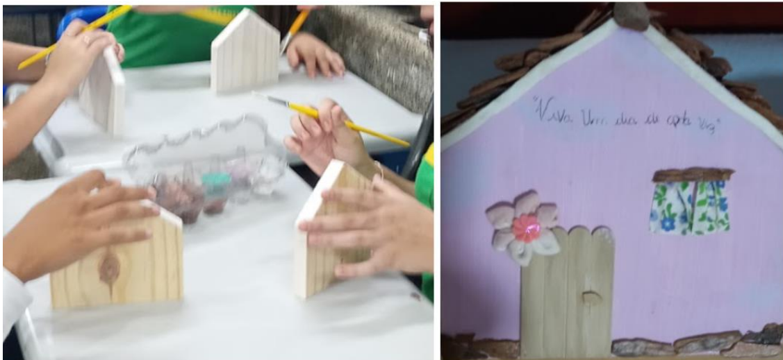
Figura 14: Processo de criação das esculturas e peça de estudante com a frase: “viver um dia de cada vez”.

A diversidade de estilos e materiais utilizados refletiu a individualidade de cada participante (Figura 14), sublinhando a importância da expressão artística no desenvolvimento pessoal (Diário 4, B. 6). A interação e colaboração entre os estudantes foram marcantes durante o processo criativo, enfatizando a construção coletiva do conhecimento e a valorização da diversidade de abordagens artísticas, configurando-se como um espaço de autonomia (Freire, 1996) e expressão individual (Duarte Junior, 1981), no qual os alunos puderam aprimorar suas habilidades artísticas e reforçar sua autoconfiança.