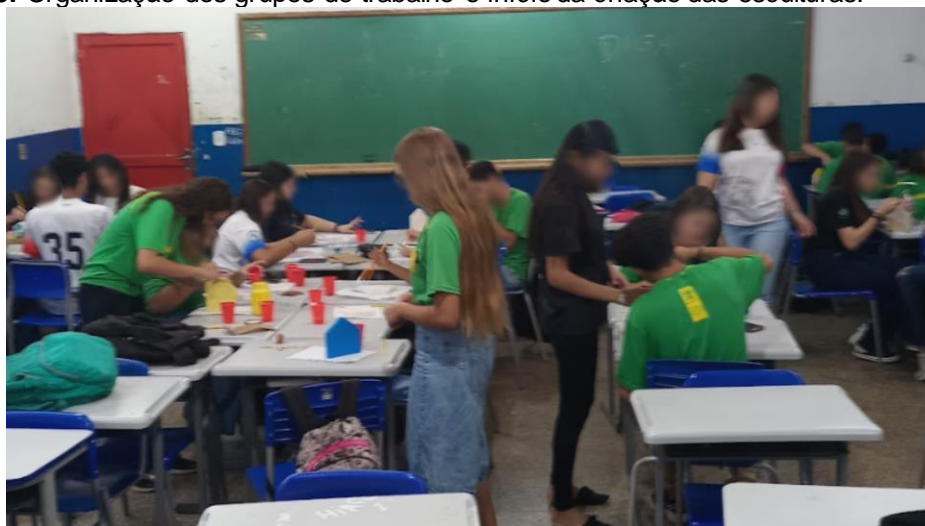
Figura 5: Organização dos grupos de trabalho e início da criação das esculturas.

O título desta categoria surgiu no Diário de Campo 2, na unidade 6 e trata da descrição do momento em que os estudantes estavam se organizando para iniciar a Oficina, especificamente, a primeira demão nas madeiras que seriam a base de suas criações. Os excertos que compõem esta categoria são aqueles que contemplam os processos de ensino e aprendizagem pela ação docente, como disse Paulo Freire (1996, p. 30) "[...] é fundamental que os educadores e educandos reconheçam sua inserção no mundo, compreendendo sua própria realidade cultural e social como ponto de partida para a aquisição do conhecimento".