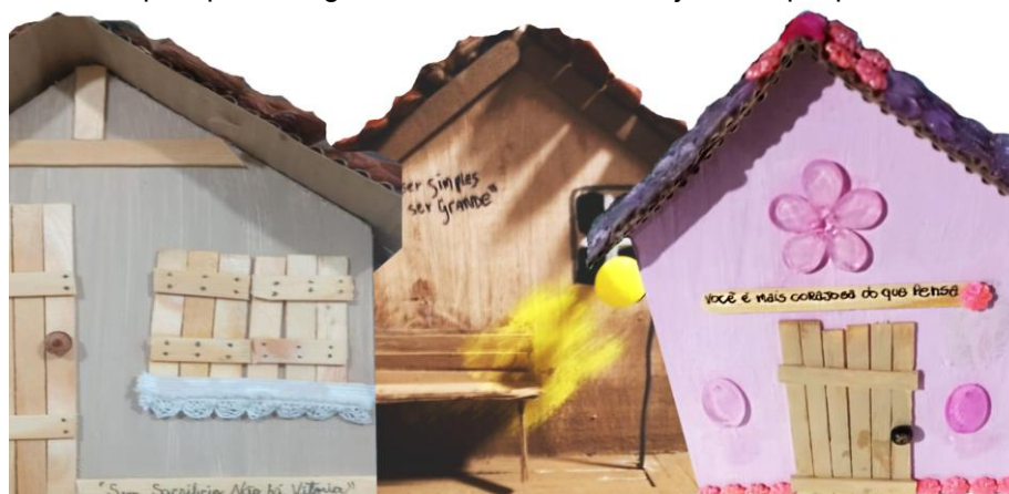
Figura 10: Algumas das frases criadas pelo grupo discente: “sem sacrifício não há vitória”, “ser simples para ser grande”, “você é mais corajoso do que pensa”.