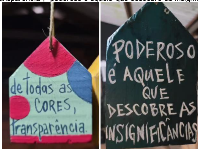
Figura 9: Casinhas com algumas das frases grafadas pela artista Rozi Santos: “de todas as cores, transparência”; “poderoso é aquele que descobre as insignificâncias”.

Considerando a abordagem poética de Rozi Santos, que faz uso de frases na execução de suas esculturas (Figura 9), propus que cada estudante escolhesse e escrevesse uma frase em seu trabalho, que poderia ser um pensamento próprio ou uma citação de um artista, refletindo algo pessoal ou inspirador, por meio de uma frase longa ou curta.