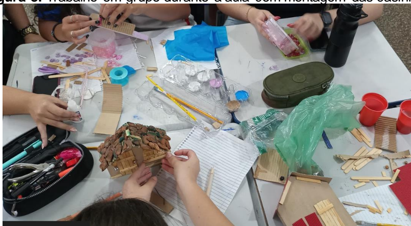
Figura 8: Trabalho em grupo durante a aula com montagem das casinhas.

Considerando esse contato com a obra de Santos e vivência prática, em continuidade à introdução formal do tema pela intervenção pedagógica, observamos que através da pintura e montagem de suas próprias peças, (Diário 3), os alunos puderam expressar suas emoções, ideias e percepções artísticas, transformando os materiais em objetos únicos e personalizados (Figura 8). Essa forma de trabalho se materializa por meio da capacidade criadora , que, para Duarte Junior (1981), se manifesta na Educação, por sua vez, fundamentada: “[...] na realidade existencial dos educandos, e a aprendizagem significativa tem maior possibilidade de ocorrência” (p. 56).”