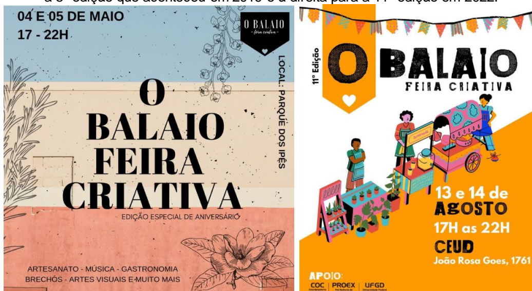
Figura 2: cartazes para divulgação online do evento O Balaio – Feira Criativa. À esquerda para a 5ª edição que aconteceu em 2019 e à direita para a 11ª edição em 2022.