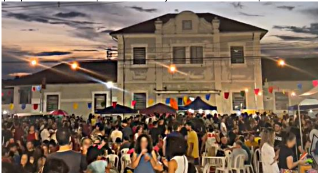
Figura 3: Registro de parte da população presente durante a 15ª edição do evento, realizada pela primeira vez em Campo Grande em março de 2023 em frente à Esplanada Cultural.

Em 2023, o Balaio realizou sua primeira edição em Campo Grande (Figura 3), de acordo com Taís Wölfert (2023), em uma correalização do Governo do Estado por meio da Fundação de Cultura e com apoio do Sesc MS, atraindo um público de 3 mil pessoas. Neste ano de 2024, a feira expandiu-se para outras cidades do estado, já tendo alcançado Ponta Porã, Rio Brillhante, Ivinhema e Naviraí, acolhendo e reunindo artistas populares em cada edição e viabilizando um polo de vendas, encontros e de respeito às diversidades por meio de uma celebração à cultura local.