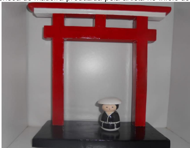
Figura 7: Boneca de madeira produzida pela artista no início de sua carreira.

Consideramos que a arte pode ser uma poderosa ferramenta de expressão e transformação, permitindo que os alunos explorem sua criatividade, desenvolvam a sensibilidade estética e se expressem por meio de diferentes linguagens, pensamento que corrobora com Duarte Junior (1981) no contexto de que “[...] através da arte o homem encontra sentidos que não podem se dar de outra maneira senão por ela própria” (p. 14).