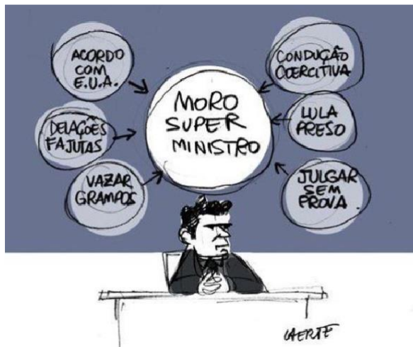
Figura 11 - PowerPoint

Autor: Laerte Coutinho. Ano 2018.