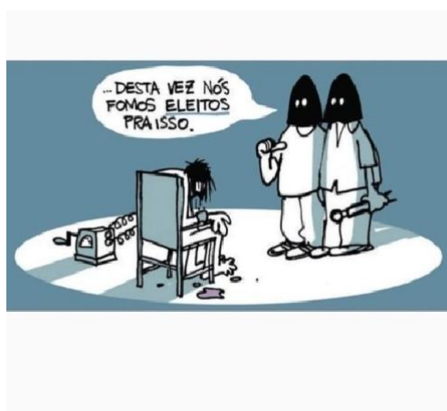
Figura 25 - Tortura

Fonte: Instagram (@lartegenial). Autor: Laerte Coutinho. Ano 2018: