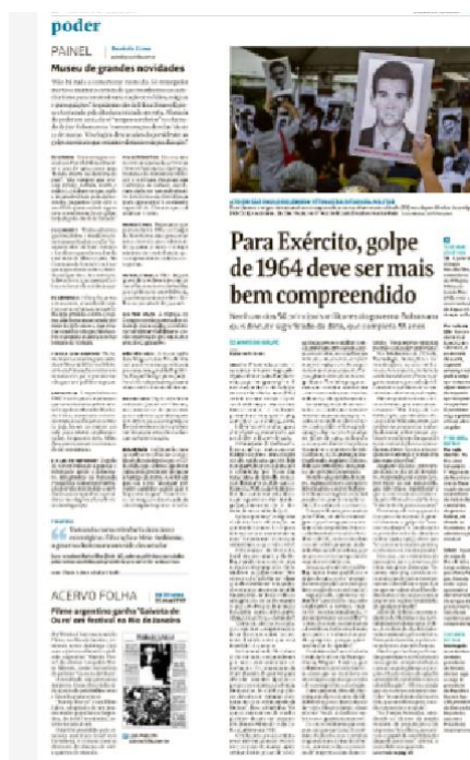
Figura 24 – Em defesa do Golpe

Em concomitância com o mês em que foi veiculada a charge da figura 24, março de 2018, quando se completaram 55 anos do início da ditadura, a Folha de São Paulo fez um texto em seu Caderno de Opinião “Do golpe de 64 à ditadura”, que relembra os caminhos e ações provocadas no percurso dos 21 anos de abusos correspondentes ao período em que os militares estiveram no poder. Na página seguinte (A4), em Painel, Dilma Rousseff, com o título “Museu de grandes novidades”, alerta: “Não há nada a comemorar neste dia, só rezar pelos mortos e manter a certeza de que resistiremos ao autoritarismo para construir uma nação sem ódio, mágoas e perseguições.”