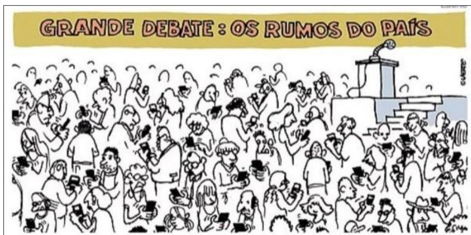
Figura 8 - Grande Debate: os rumos do país.

Autor: Laerte Coutinho. Ano 2018.