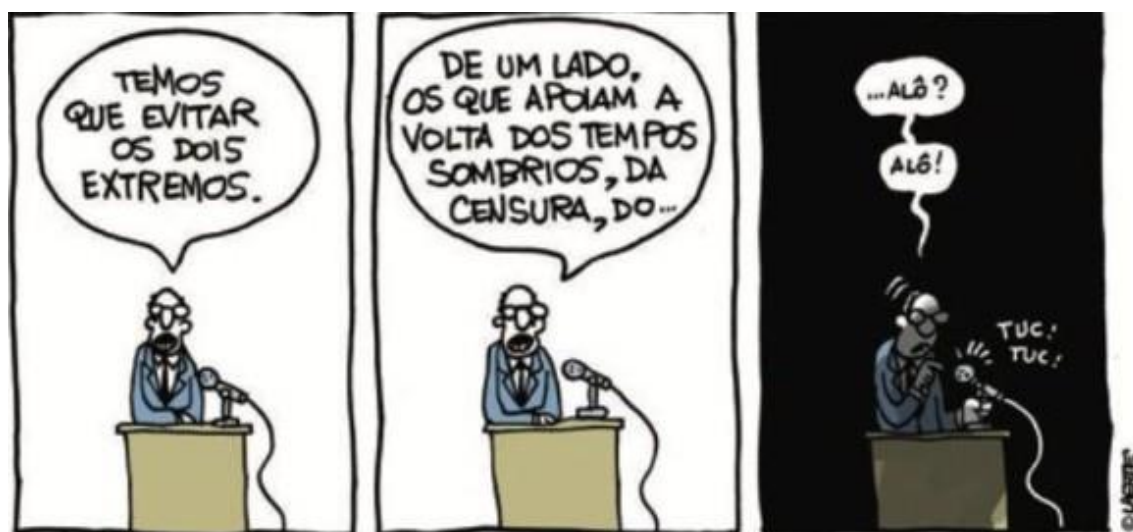
Figura 6 - Discurso no escuro.

Autor: Laerte Coutinho. Ano 2018.