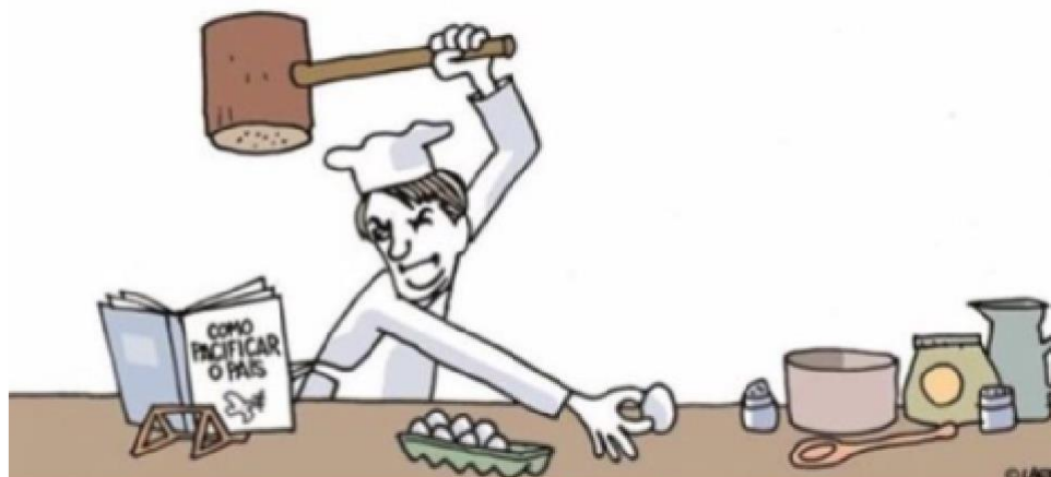
Figura 26 – “Delicadeza”

Autor: Laerte Coutinho. Ano 2018