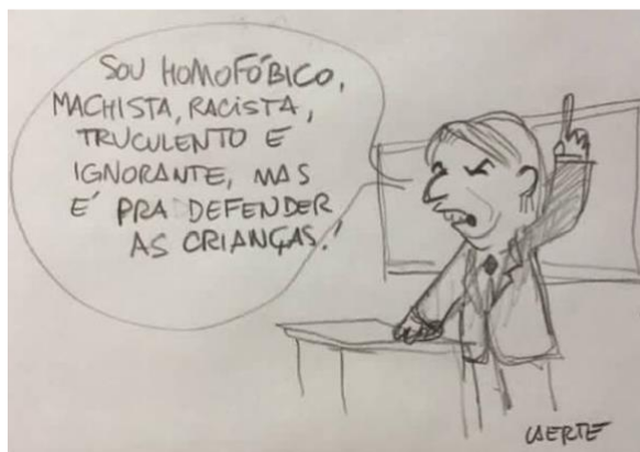
Figura 10 – Sinceridades criminosas

Autor: Laerte Coutinho. Ano 2018.