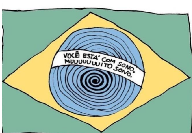
Figura 5 - "Você está com sono, muuuuuuito sono".

Autor: Laerte Coutinho. Ano 2018.