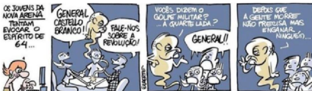
Figura 15 - Fantasma da ditadura 2

Autor: Laerte Coutinho. Ano 2018.