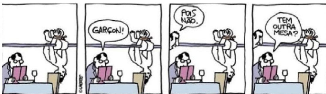
Figura 28 - Banalidade

Autor: Laerte Coutinho. Ano 2018