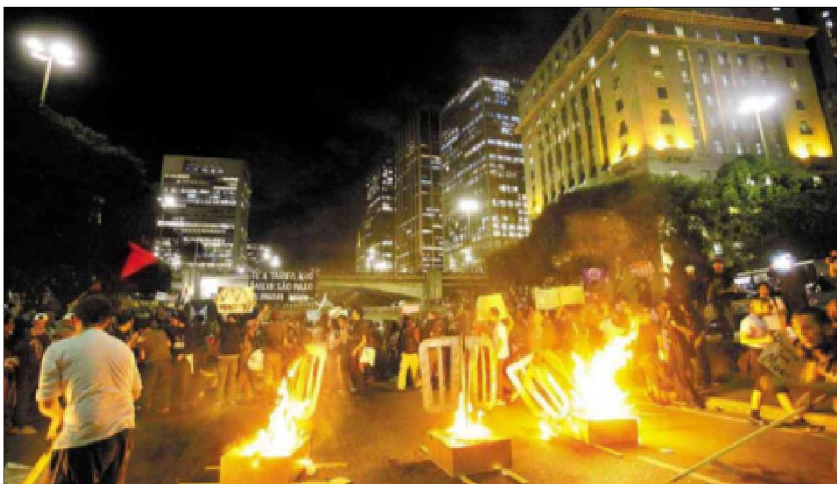
Figura 1 - Manifestações na av. Paulista.

A imprensa tradicional logo buscou associar os integrantes mais exaltados que participaram das ações aos partidos de esquerda, mesmo que desde o início os organizadores do Movimento Passe Livre (MPL) tentassem desvincular qualquer partido político ao movimento.