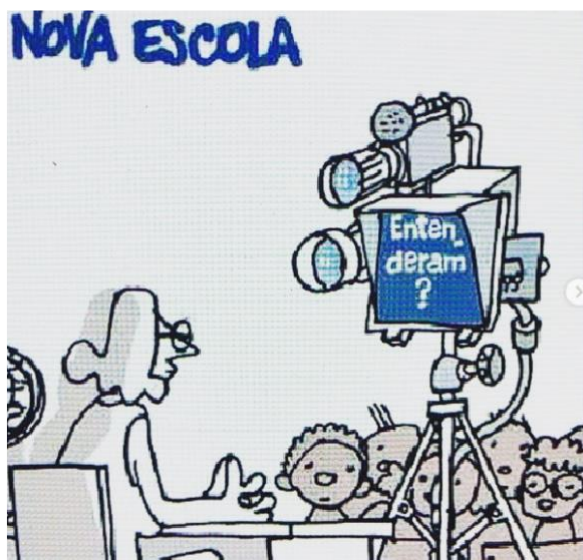
Figura 31 - Nova Escola

Fonte: Instagram (@lartegenial). Autor: Laerte Coutinho. Ano 2018