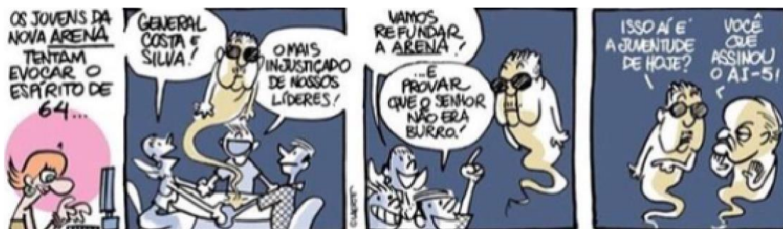
Figura 14 - Fantasma da ditadura 1

Autor: Laerte Coutinho. Ano 2018.