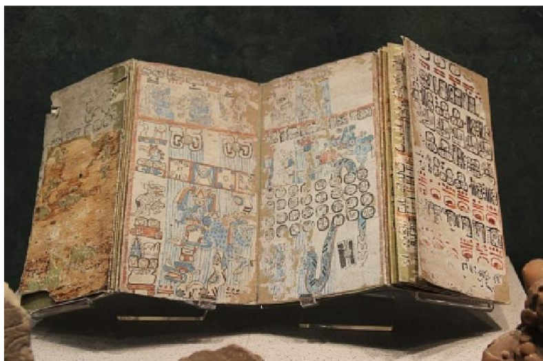
Figura 3 – Manuscrito Códice Grolier (Povos Maias).

Fonte: Pueblos Originários. Maias. Por volta de 1485.