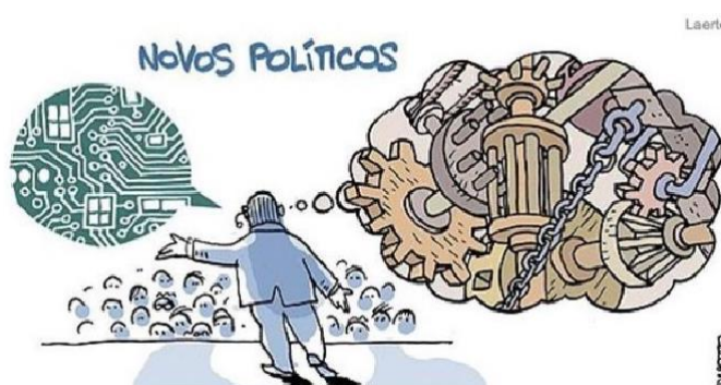
Figura 12 - Novos Políticos

Fonte: Instagram (@lartegenial). Autor: Laerte Coutinho. Ano 2018.