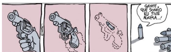
Figura 21 – sonho ou pesadelo.

Autor: Laerte Coutinho. Ano 2018