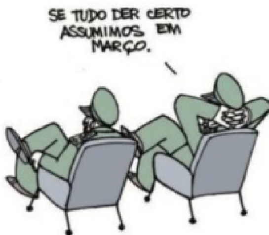
Figura 23 - Ditadura Militar 1

Fonte: Instagram (@lartegenial). Autor: Laerte Coutinho. Ano 2018