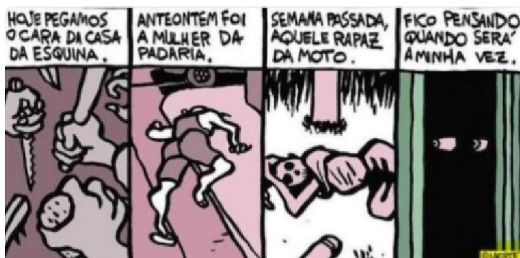
Figura 27 - Violência

Autor: Laerte Coutinho. Ano 2018