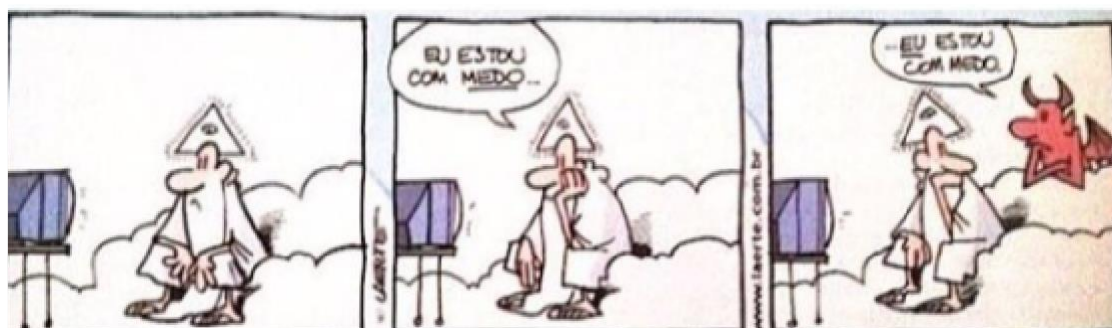
Figura 18 - Deus e o Diabo

Autor: Laerte Coutinho. Ano 2018.