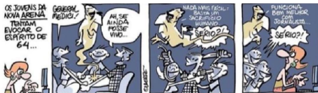
Figura 16 - Fantasma da ditadura 3

Autor: Laerte Coutinho. Ano 2018.