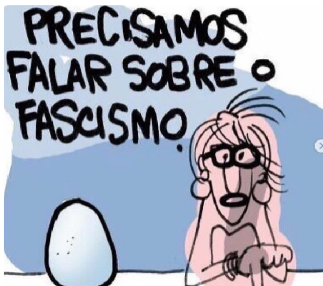
Figura 13 – O ovo da serpente

Fonte: Instagram (@lartegenial). Autor: Laerte Coutinho. Ano 2018.