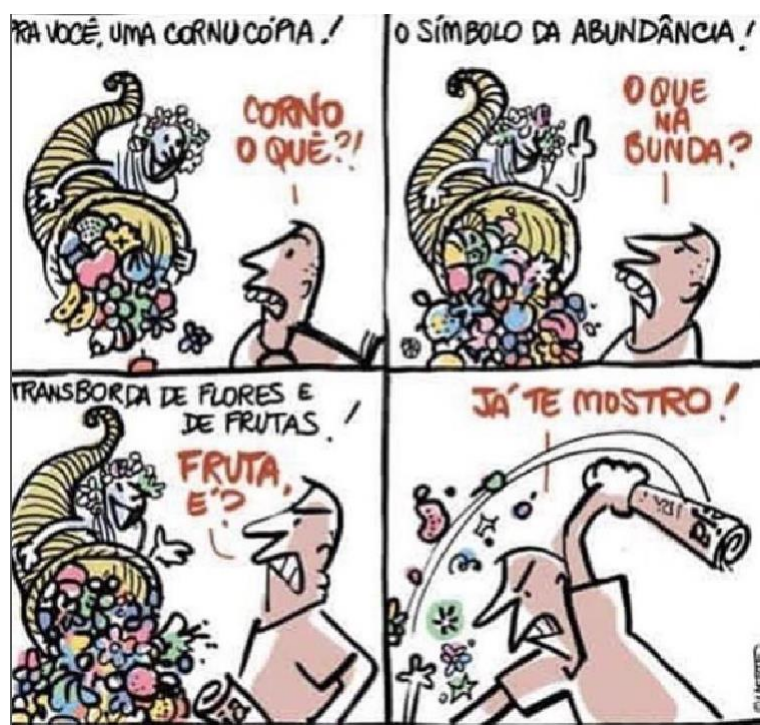
Figura 29 - Cornucópia

Fonte: Instagram (@lartegenial). Autor: Laerte Coutinho. Ano 2018