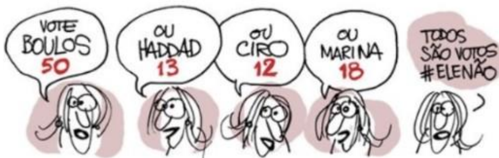
Figura 7 - Opções de voto.

Autor: Laerte Coutinho. Ano 2018.