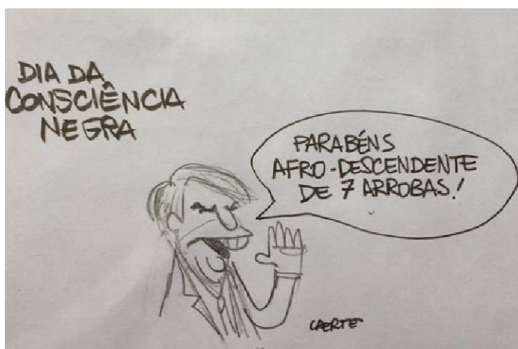
Figura 30 - Racismo

Autor: Laerte Coutinho. Ano 2018