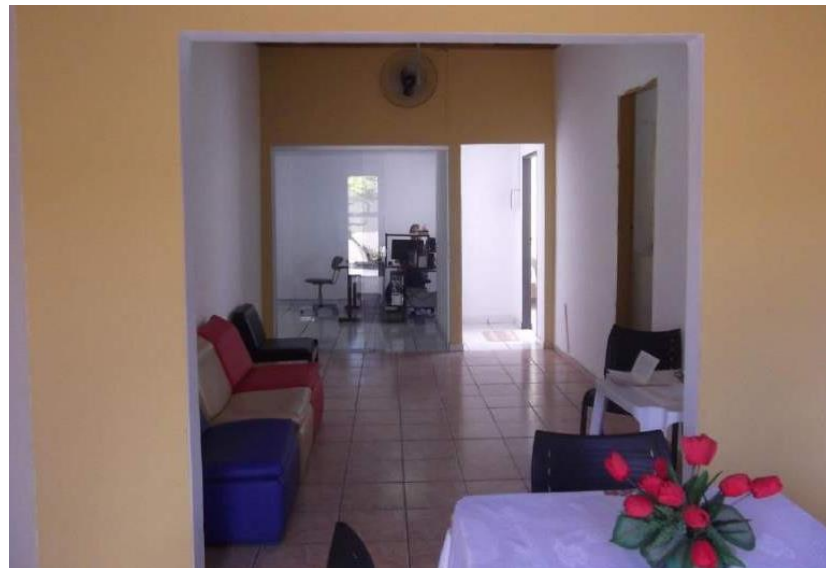
Figura 4 – Creche

Desta maneira, é possível nas fotos abaixo, verificar um pouco da infraestrutura local do estabelecimento penal feminino Irmã Irma Zorzi.