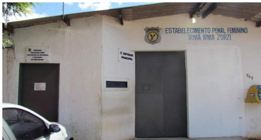
Figura 3 - Estabelecimento Penal Feminino Irmã Irma Zorzi – Campo Grande, MS

A figura abaixo, traz, a fachada do Estabelecimento Penal Feminino Irmã Irma Zorzi, na capital: