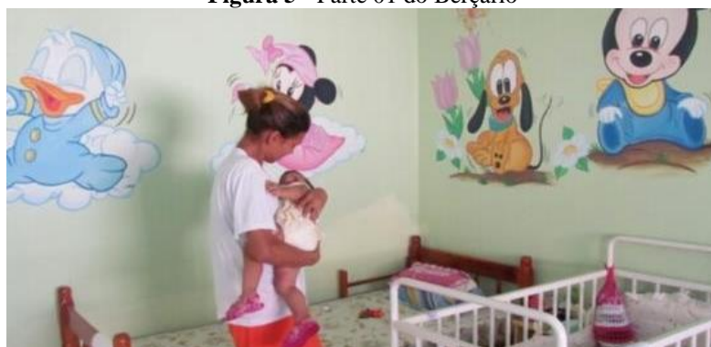
Figura 5 - Parte 01 do Berçário