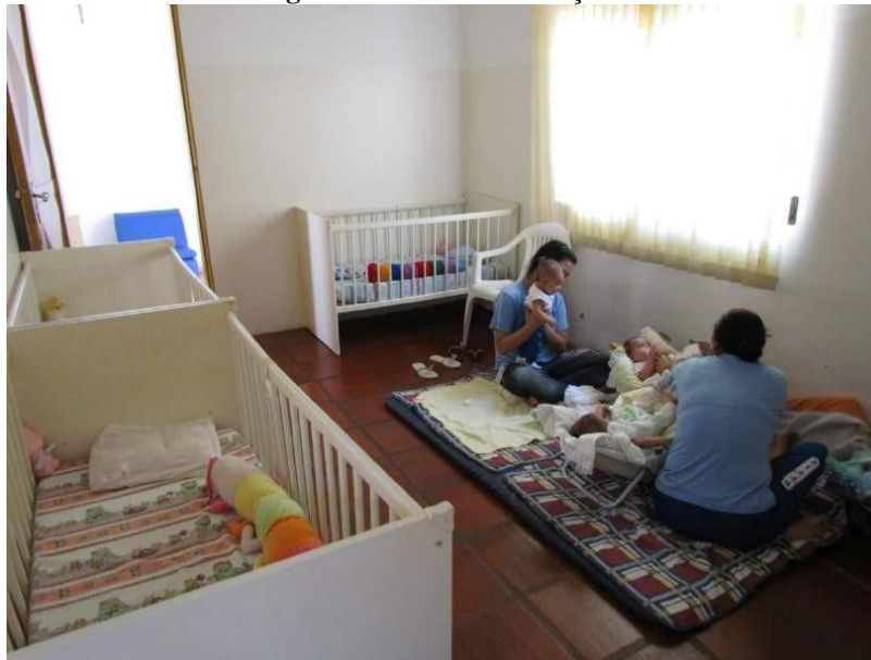
Figura 6 - Parte 02 do Berçário