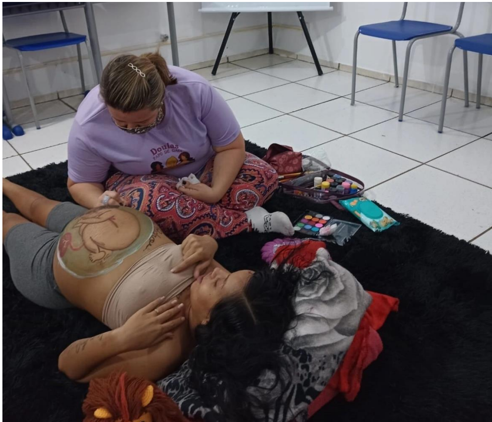
Figura 7 - Projeto sendo desenvolvido no Estabelecimento Penal em tela