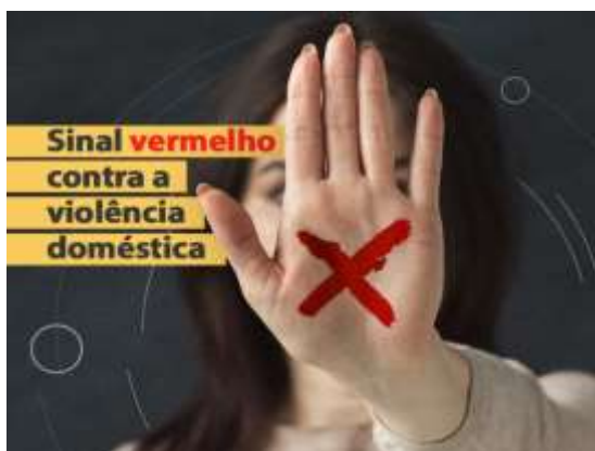
Figura 5: Sinal Vermelho contra a Violência Doméstica