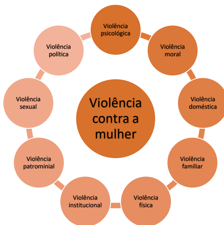
Figura 1 – Tipos de Violência contra a Mulher

De acordo com Saffioti (2011, p. 67), as diversas modalidades de violência, não ocorrem de maneira isolada, impossibilitando a utilização do conceito de violência individualmente. Assim, rodeiam as mulheres variadas formas de violência, conforme figura abaixo.