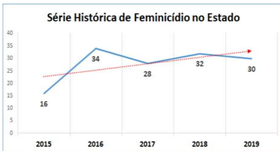
Figura 3: Feminicídio no Estado de Mato Grosso do Sul de 2015 a 2019