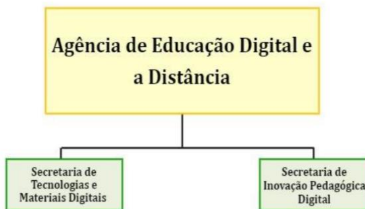
Figura 3 - Sistema organizacional AGEAD.